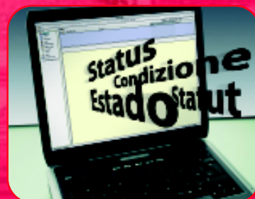
Administracja urządzenia jest niezwykle łatwa i może odbywać się zdalnie.