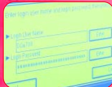
Dostęp do urządzenia może być zabezpieczony Autoryzacją Windows.