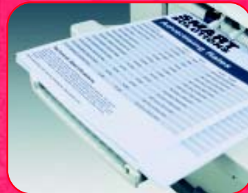
Duża szybkość druku zwiększa produktywność pracowników.

Nashuatec DSm725 i DSm730 integrują się szybko i bez przeszkód z Twoim środowiskiem sieciowym. Opcjonalne interfejsy Wireless LAN i Bluetooth pozwalają korzystać z wygody podłączenia urządzeń bez użycia kabli, dzięki najnowszym osiągnięciom technologii mobilnej.